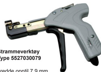
Strammeverktøy Type 5527030079

bredde opptil 7,9 mm med skjærestyr Vekt: 0,56 kg Lengde: 180 mm